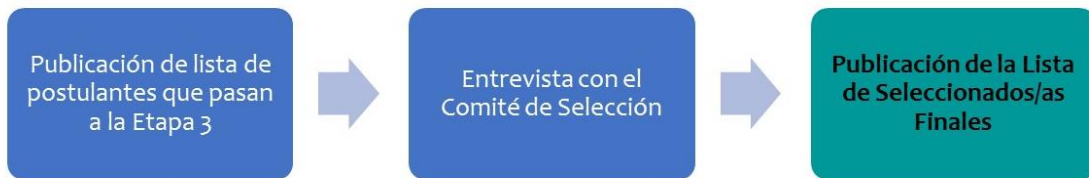
Diagrama Etapa 3. Selección

Sólo las personas cuyos nombres han sido publicados en la Lista de postulantes que pasan a la Etapa 3 podrán participar en ésta. Se les contactará para agendar una entrevista con el Comité de Selección, quien determinará, de manera inapelable, a las/os beneficiarias/os del Programa. Los nombres se publicarán en el mismo sitio web en la fecha indicada en el Calendario General.