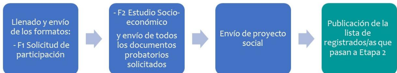
Diagrama Etapa 1. Registro

No serán tomados en cuenta aquellos registros incompletos, con documentación y/o información falsa o extemporáneos.